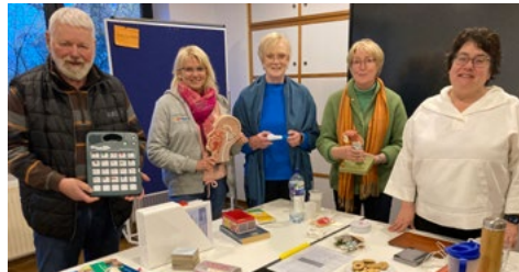
Die Schulungsinhalte werden praxisnah und mit Spaß vermittelt.

Die Diakonie Gütersloh bildet seit 2016 regelmäßig ehrenamtliche Schlaganfall-Helfer aus, die kreisweit tätig sind. Dank der finanziellen Unterstützung durch die Volksbank Stiftung kann das Team weiter ausgebaut werden. Die Diakonie Gütersloh sucht dafür interessierte Ehrenamtler, die sich zum Schlaganfall-Helfer ausbilden lassen möchten. Die Schulungsinhalte umfassen neben den medizinischen, therapeutischen und psychologischen Grundlagen auch Kommu-